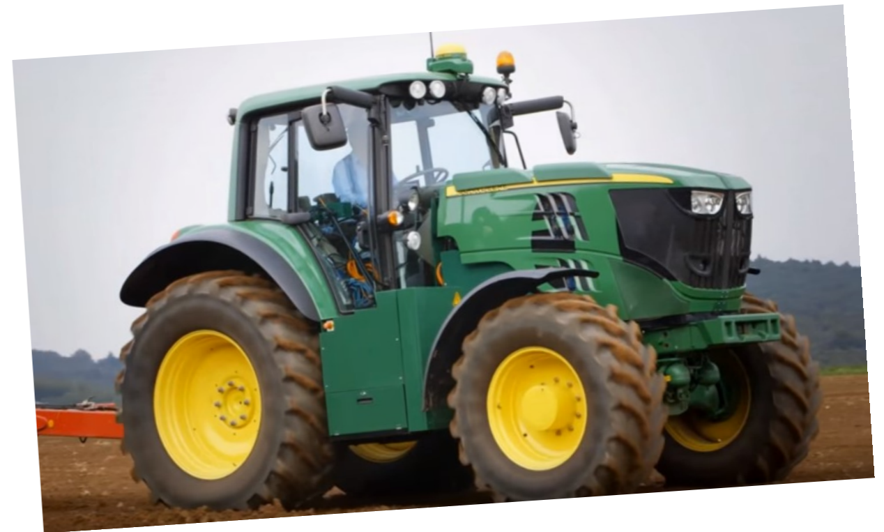
Elektrische trekker John Deere

als die af is mail je die naar: oever@zone.college Van 't Oever gaat het printen en dan kun jij het toevoegen aan de map. Bij het mondeling examen krijg je hier vragen over. Besteed in deze presentatie ook aandacht aan innovatie.