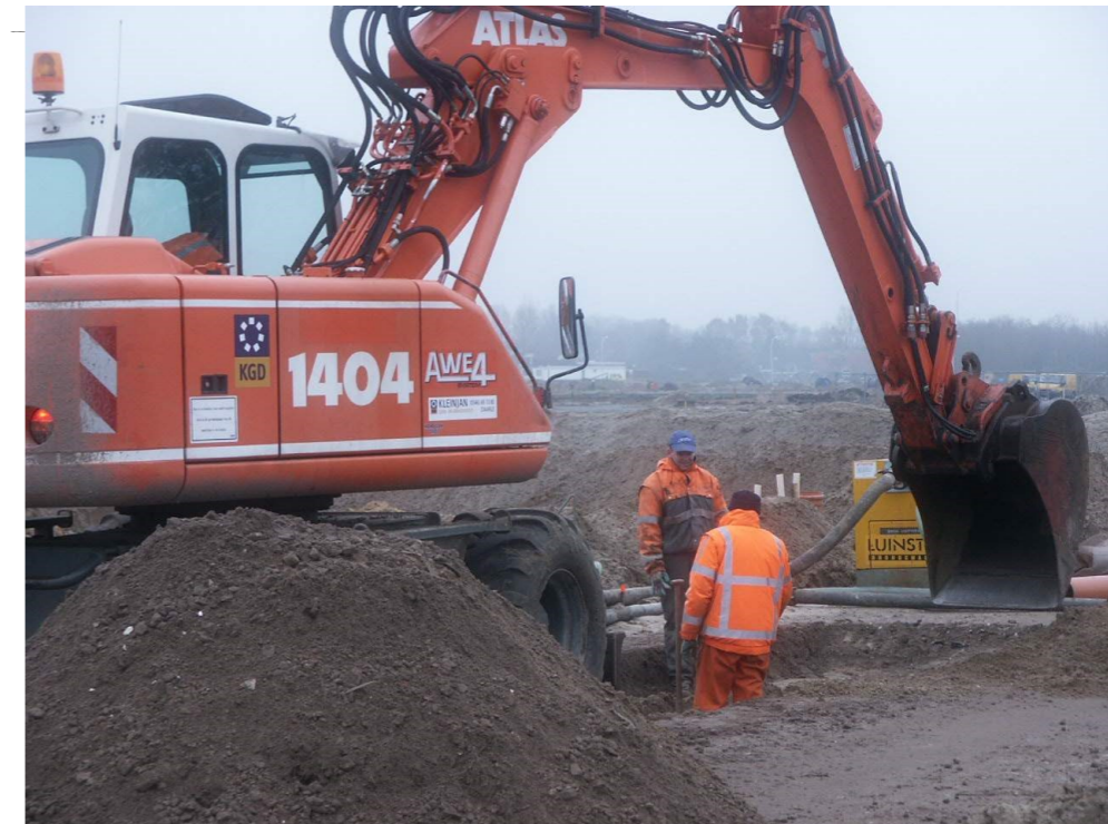
Een Atlas 1404 zonder draaikantelstuk? Hier valt wel iets te innoveren.....