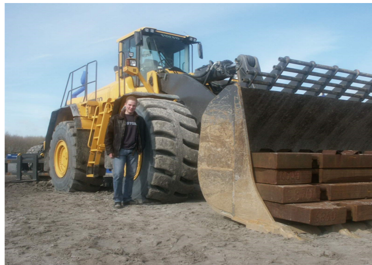
Jij bent wel het visite kaartje van het loonbedrijf